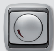
Regulador Giratorio Arco