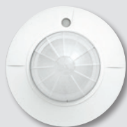
Detector de techo