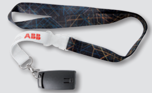
Pulsador colgante de alarma, pánico o llamada de auxilio Wireless