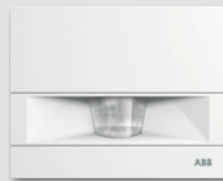
Detector MasterLINE 70 / 100

A través de los detectores de movimiento es posible conectar y desconectar automáticamente la iluminación o circuito eléctrico deseado. De esta manera, detectan que una habitación vacía tiene la luz encendida o la calefacción a pleno rendimiento y procede a su apagado, logrando importantes ahorros económicos y energéticos.