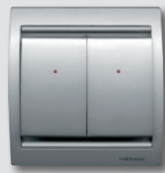
Interruptor Olas Wireless

Wireless es el nuevo sistema de control con tecnología inalámbrica. Sus emisores, elementos de control instalados en la pared, están diseñados para controlar el encendido y apagado de luces, las persianas y otras muchas funciones en el hogar para aportar una mayor comodidad y calidad de vida.