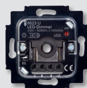
Mecanismo Regulador Giratorio

El LED define una nueva luz, especialmente cuando se trata de ahorrar energía. Por eso los nuevos reguladores LED de Niessen proporcionan el nivel de iluminación realmente necesario, y con un diseño adecuado a todo tipo de gustos y tendencias de interiorismo.