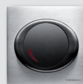
Regulador Giratorio Tacto