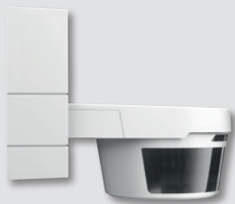
Detector de pared