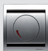
Regulador Giratorio Olas