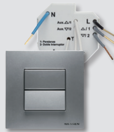
Interruptor Zenit Wireless